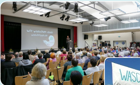
Multiplikatoren-Tagung 2017, Fulda

http://forum-waschen.de/aktionstag-nachhaltig-ab-waschen.html