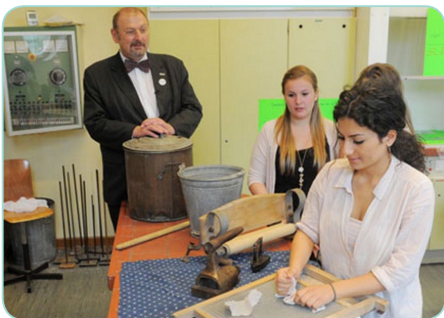
Prof. Dr. Dr. Hensel, Präsident des Bundesinstituts für Risikobewertung, in der Luise Henriette-Schule, Berlin 2012

Weitere Informationen zu Aktionen in Schulen und zur Anmeldung können unter dem Menüpunkt „Schulmaterialien“ abgerufen werden: http://forum-waschen.de/schulmaterialien-reinigungs-waschmittel.html